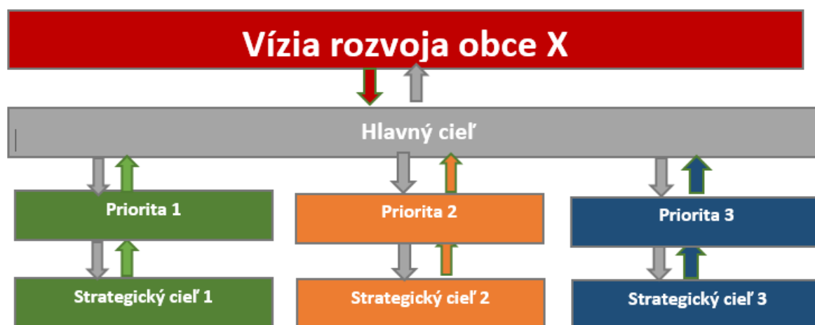
Obr. Prepojenie a väzby medzi definovaním Vízie rozvoja, Hlavného cieľa a priorít obce Richnava

Obrázok nižšie ilustruje prepojenie a väzby medzi definovaním Vízie rozvoja, Hlavného cieľa a priorít obce Richnava, ktorých naplnenie je možné dosiahnuť prostredníctvom naplnenia cieľov jednotlivých nástrojov (projektov), ktoré povedú k naplneniu jednotlivých špecifických cieľov, prostredníctvom ktorých je možné naplniť strategické ciele určené pre každú prioritnú oblasť obce.